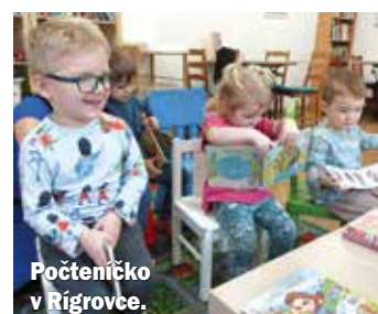
Počteničko v Rígrovce.