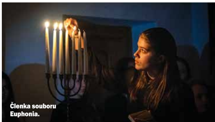
Členka souboru Euphonia.