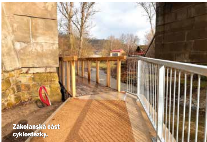
Zákolanská část cyklostezky.

◀◀ Cyklostezka mezi Kralupy nad Vltavou, Otvovicemi a Zákolany byla dokončena.