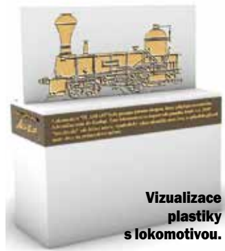
Vizualizace plastiky s lokomotivou.