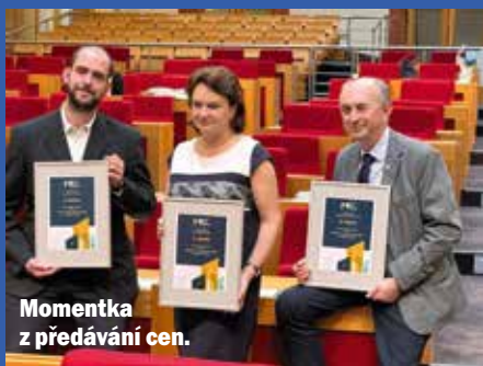
Momentka z předávání cen.