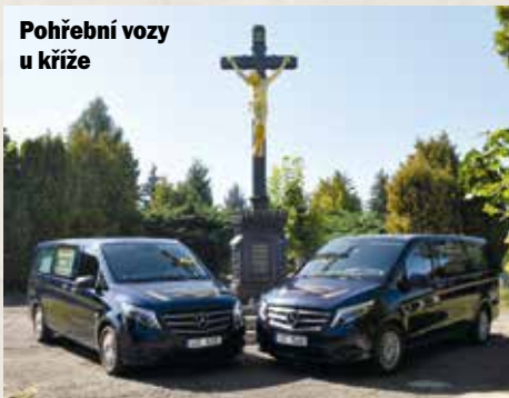
Pohřební vozy u kříže