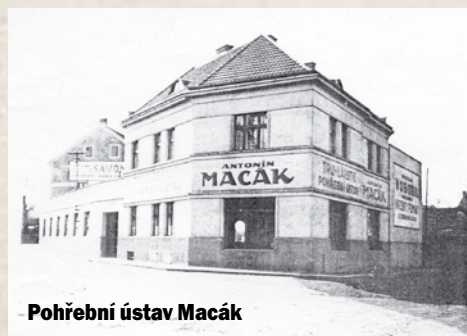
Pohřební ústav Macák

Tato cesta zůstala zapsána i v paměti básní-