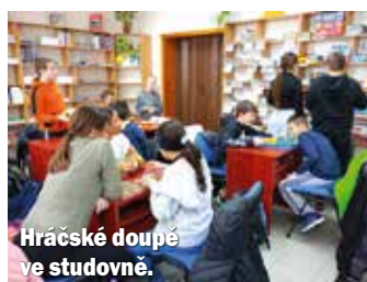
Hráčské doupe ve studovně.