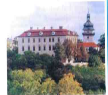
Dominanta města Benátky n. Jiz. Vás zve na první letošní zájezd, jehož jsou poslední zastávkou.