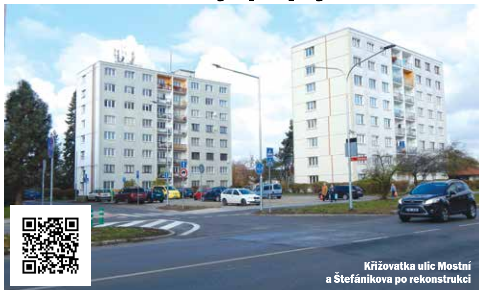
Křižovatka ulic Mostní a Štefánikova po rekonstrukci