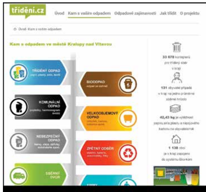
Ilustrační náhled nové sekce webu:

Kampaň na podporu třídění odpadů bude v těchto dnech zahájena spuštěním speciální sekce „Kam s odpadem v Kralupech nad Vltavou“ na webu trideni.cz , ve které nalezneme souhrnné informace k třídění odpadů v rámci našeho města. Do všech schránek kralupských domácností následně proběhne distribuce nové brožury se základními zásadami, jak správně třídít odpad.