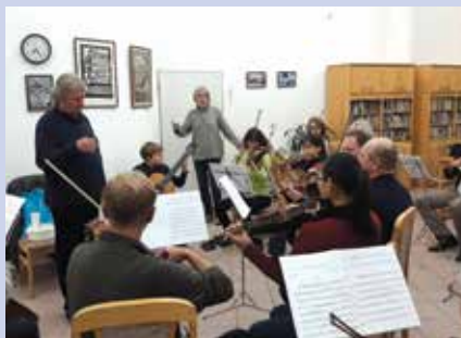
Zkouška KODK a žáků ZUŠ na společný listopadový koncert