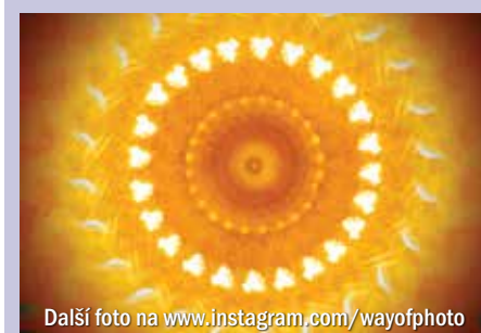
Další foto na www.instagram.com/wayofphoto

UPOZORNĚNÍ: Změna programu v sobotu 11. listopadu 2017. Z technických důvodů (přesunutí termínu základních tanečních kurzů pro mládež) jsme byli nuceni zrušit letošní tradiční Svatomartinskou slavnost. Děkujeme za pochopení!